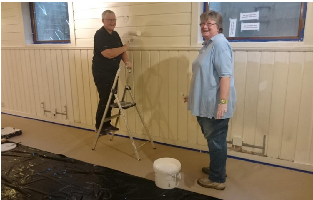
«Kontoret» pusser opp kjellerstua.

Utvalget har ikke vært i funksjon i 2016.